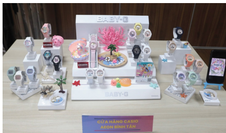
Bài dự thi mang chủ đề "Happy summer" đạt giải Nhất đến từ Cửa hàng Casio Aeon Mall Bình Tân

Cuộc thi cũng đã tìm được danh hiệu xứng đáng, trong đó giải Nhất thuộc về đội cửa hàng Casio Aeon Mall Bình Tân, giải Nhì thuộc về đội cửa hàng Casio Takashimaya, giải Ba thuộc về đội cửa hàng Casio Flagship, giải Khuyến khích thuộc về 2 đội gồm cửa hàng Casio Aeon Mall Tân Phú và cửa hàng Casio 213 Nguyễn Văn Cừ.