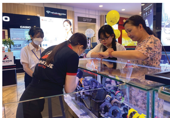
Ban giám khảo đến trực tiếp từng cửa hàng chấm điểm phần trưng bày trong vòng 1

Từ 1 - 20/6 là thời gian để 5 cửa hàng lập đội, chọn 2 thành viên có kỹ năng trưng bày tốt, tiếp tục đăng ký chủ đề trưng bày tham gia vòng 2. Tại vòng thi cuối, 5 đội thi có 45 phút để hoàn thành phần trưng bày của mình, sau đó đại diện của đội thuyết trình, giới thiệu chủ đề, ý tưởng trưng bày.