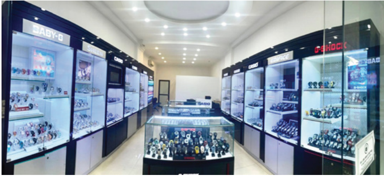
Không gian trưng bày của cửa hàng Outlet đồng hồ Casio đầu tiên có mặt tại Hà Nội

Nhân dịp này, Anh Khuê Watch cũng mang đến nhiều chương trình ưu đãi dành cho quý khách hàng đến tham quan và mua sắm tại cửa hàng. Cụ thể: