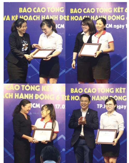
Ban Lãnh đạo công ty trao bằng khen và phần thưởng cho các cửa hàng có tỷ lệ tăng trưởng doanh thu vượt trội