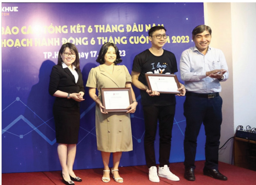
Vinh danh tập thể phòng Công nghệ Thông tin và Phòng kho vận trong việc nghiên cứu và ứng dụng FIFO.

Đại diện Ban Lãnh đạo, Kinh doanh Sĩ, Kinh doanh Lê và các chi nhánh, các phòng ban cam kết hoàn thành nhiệm vụ trong 6 tháng cuối năm 2023.