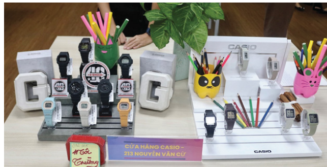
Cửa hàng Casio Aeon Mall Tân Phú và Cửa hàng Casio 213 Nguyễn Văn Cừ đồng giải Khuyến khích.