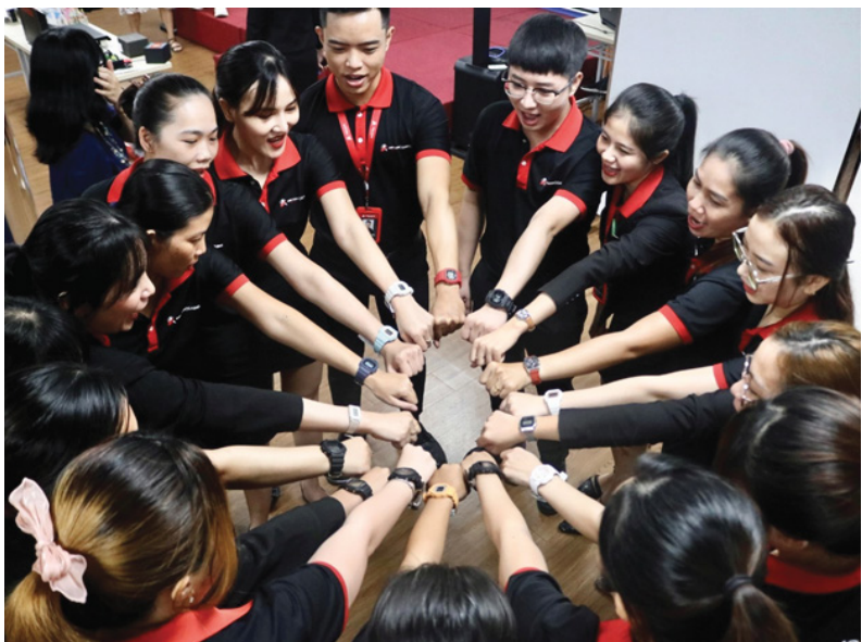
5 đội thể hiện ý chí quyết tâm giành chiến thắng trước khi cuộc thi bắt đầu.

Trong đó, vòng 1 diễn ra từ ngày 22 - 24/05 vừa qua, đại diện phòng Kinh doanh Lê, ban giám khảo đến chấm điểm trực tiếp tại từng cửa hàng và chọn ra 5 cửa hàng có tổng điểm cao nhất tiếp tục vào vòng 2.