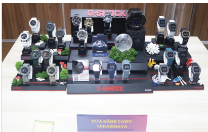
Cửa hàng Casio Takashimaya "ẵm" giải Nhì với chủ đề "Thiên nhiên và con người"